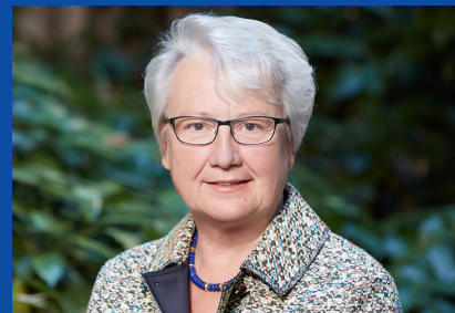
Annette Schavan, Deutsche Botschafterin am Heiligen Stuhl, Rom