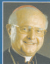
Erzbischof Dr. Robert Zollitsch, Vorsitzender der Deutschen Bischofskonferenz